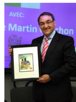
Célébration de la Journée des Franco-Ontariens et des Franco-Ontariennes avec l'honorable Martin Cauchon à Toronto

Enfin, le 21 mars était organisée une réception à Toronto, en collaboration avec le BHC et l'ABO pour célébrer la Journée de la francophonie.