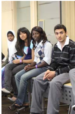
Journées du droit 2010 à Toronto— Quizz juridique