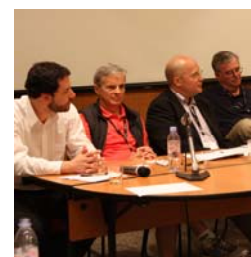
Congrès 2010— Panel sur le droit de la sécurité

avocats d'Aide juridique Ontario ont ainsi l'occasion de parfaire leurs habilités pour travailler en français. Pendant une semaine, ces derniers participent à divers séances de formation incluant des audiences simulées et des ateliers de rédaction. Cette année, la formation a eu lieu à Cornwall du 1 er au 5 novembre. La directrice générale de l'AJEFO a contribué au développement et à l'animation des ateliers.