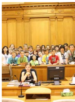
Camps en justice — Visite à la Cour supérieure de justice de l'Ontario