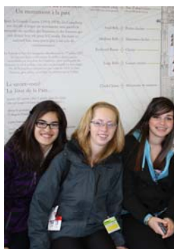
Concentration en justice — Sortie pédagogique au Parlement avec les 11e années