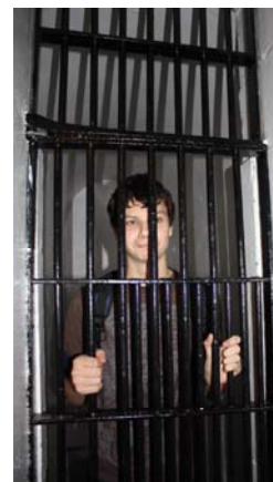
Concentration en justice — Visite de l'ancienne prison d'Ottawa

Bailleurs de fonds : Ministère de la Justice Canada, Fondation du droit de l'Ontario, Ministère de l'Éducation de l'Ontario