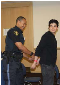
Journée du droit — Atelier d'un policier de la PPO