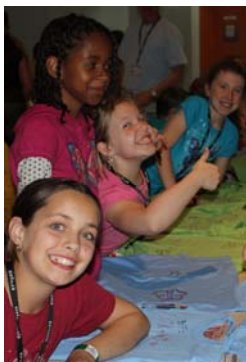
Camps en justice — Décoration de t-shirts